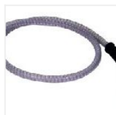
Tubo di aspirazione Codice articolo: 950