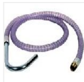
Tubo di scarico Codice articolo: 951